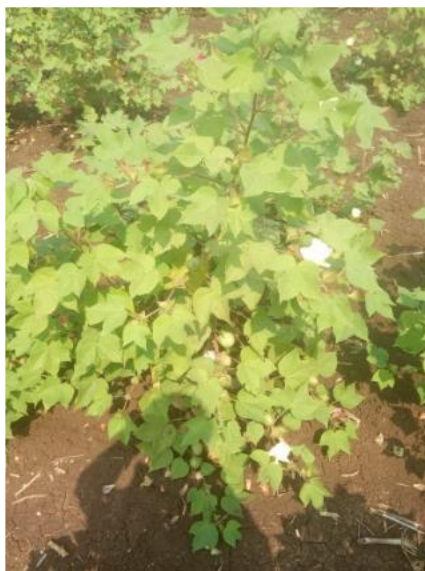
100% ИСПОЛЬЗОВАННЫЙ АГРОБАЛЬЗАМ (ЗЕЛЕНАЯ ПРИРОДА) НА МАЙНЦЕ. 100% ИСПОЛЬЗОВАННЫЙ АГРОБАЛЬЗАМ (ЗЕЛЕНАЯ ПРИРОДА) НА ХЛОПКОВОМ КУЛЬТУРЕ