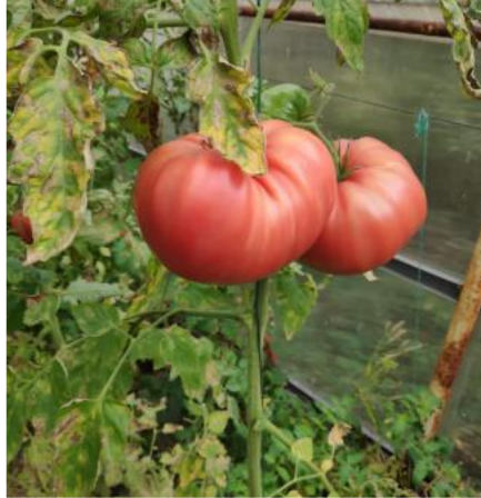
АГРОБАЛЬЗАМ ДЛЯ ВЕРТИКАЛЬНОГО ЗЕМЛЕДЕЛИЯ УРОЖАЙ ТОМАТОВ ПОСЛЕ ИСПОЛЬЗОВАНИЯ АГРОБАЛЬЗАМ (ЗЕЛЕНАЯ ПРИРОДА)