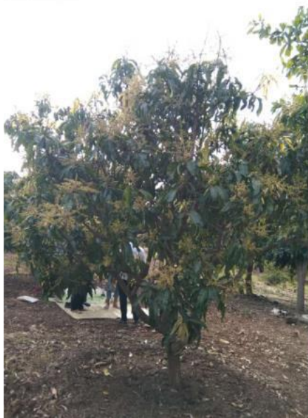
РАСПЫЛЕНИЕ НА ПОЧВУ АГРОБАЛЬЗАМОМ (ЗЕЛЕНАЯ ПРИРОДА) ЦВЕТКОВ МАНГОВОГО ДЕРЕВА, ЖЕНСКИЙ ОРГОН УЛУЧШИТЬСЯ ПОСЛЕ ИСПОЛЬЗОВАНИЯ АГРОБАЛЬЗАМА (ЗЕЛЕНАЯ ПРИРОДА)