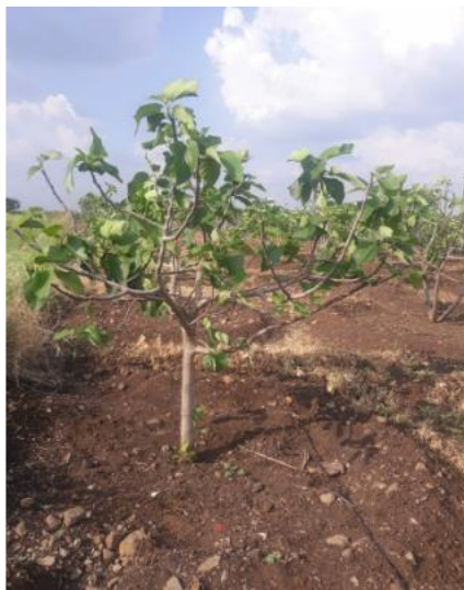
ДО..... ФИГУРА ПОСЛЕ ИСПОЛЬЗОВАНИЯ АГРОБАЛЬЗАМА ( ЗЕЛЕНАЯ ПРИРОДА ) ВРЕМЯ ЗАНЯТО 35 ДНЕЙ