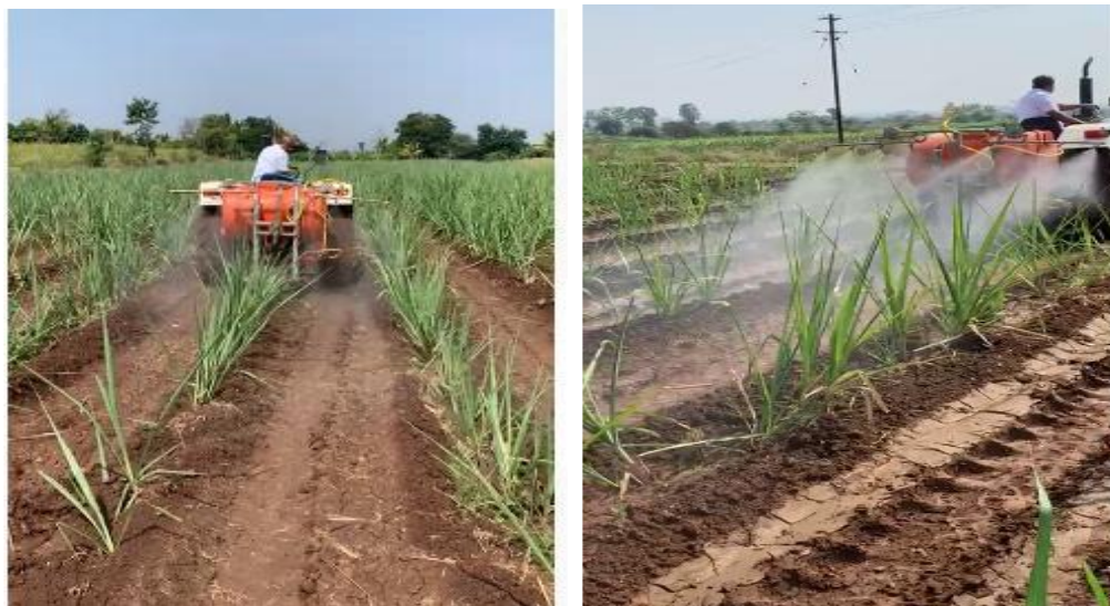
МЕТОД ОПРЫСКИВАНИЯ НА КУЛЬТАХ САХАРНОГО ТРОСТА 100% АГРОБАЛЬЗАМ (ЗЕЛЕНАЯ ПРИРОДА)