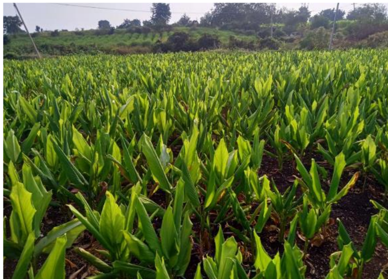
ИСПОЛЬЗУЕТСЯ 100% АГРОБАЛЬЗАМ (ЗЕЛЕНАЯ ПРИРОДА) НА ТЕРМАРИЧЕСКИХ КУЛЬТУРАХ.