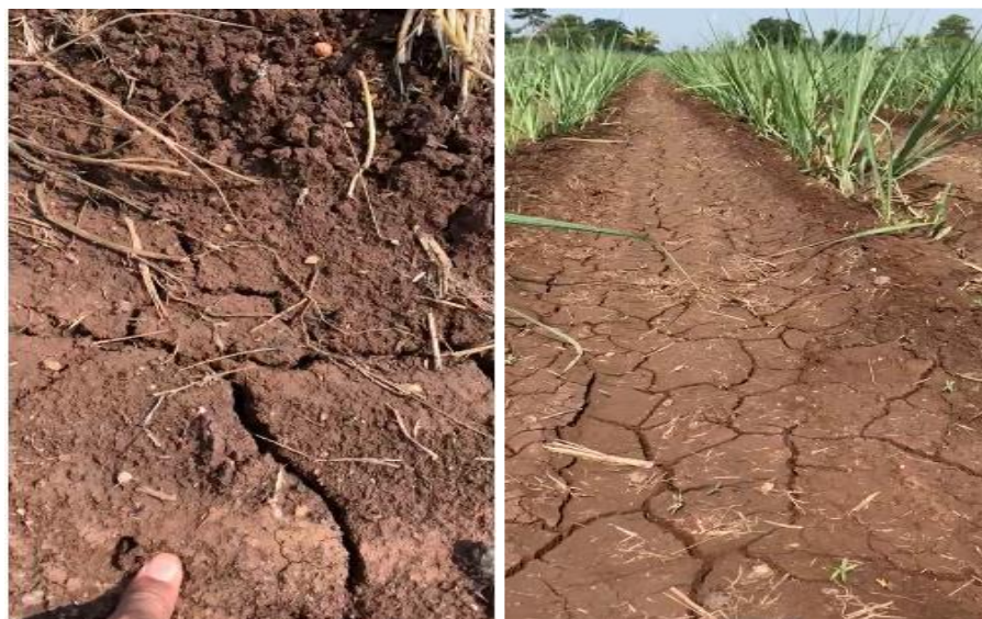
ПОСЛЕ ОПРЫСКИВАНИЯ АГРОБАЛЬЗАМОМ (ЗЕЛЕНАЯ ПРИРОДА) КАЧЕСТВО ПОЧВЫ УЛУЧШАЕТСЯ ОРГАНИЧЕСКИМ УГЛЕРОДОМ, ТАКЖЕ УЛУЧШАЕТСЯ НИКАКАЯ ТРАВА НА ПОЧВЕ.